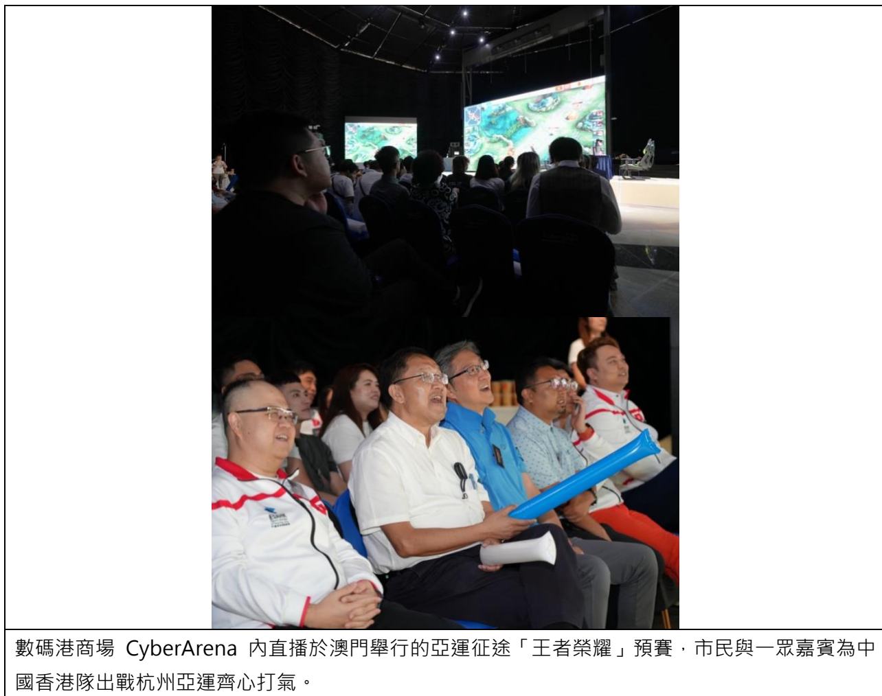
數碼港商場 CyberArena 內直播於澳門舉行的亞運征途「王者榮耀」預賽，市民與一眾嘉賓為中國香港隊出戰杭州亞運齊心打氣。