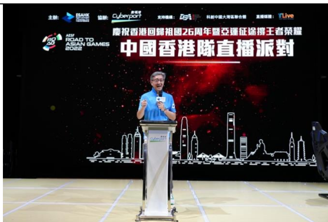
數碼港行政總裁任景信為活動致辭。